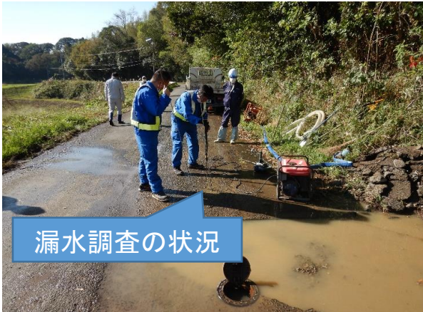
新富町 湯風呂地区