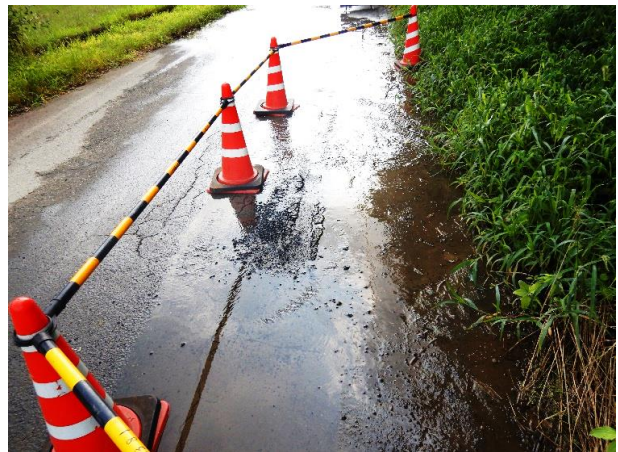
木城町 牧の内地区

当企業団の水道管は古いもので、39年が経過しております。これから漏水や赤水の発生、設備機器等の経年劣化(老朽化)による不具合が増えることが予想され、継続して漏水調査等を行いこれらの管路の更新工事(布設替工事)や水抜き作業(赤水対策等) 設備の改修を今後行ってまいります。